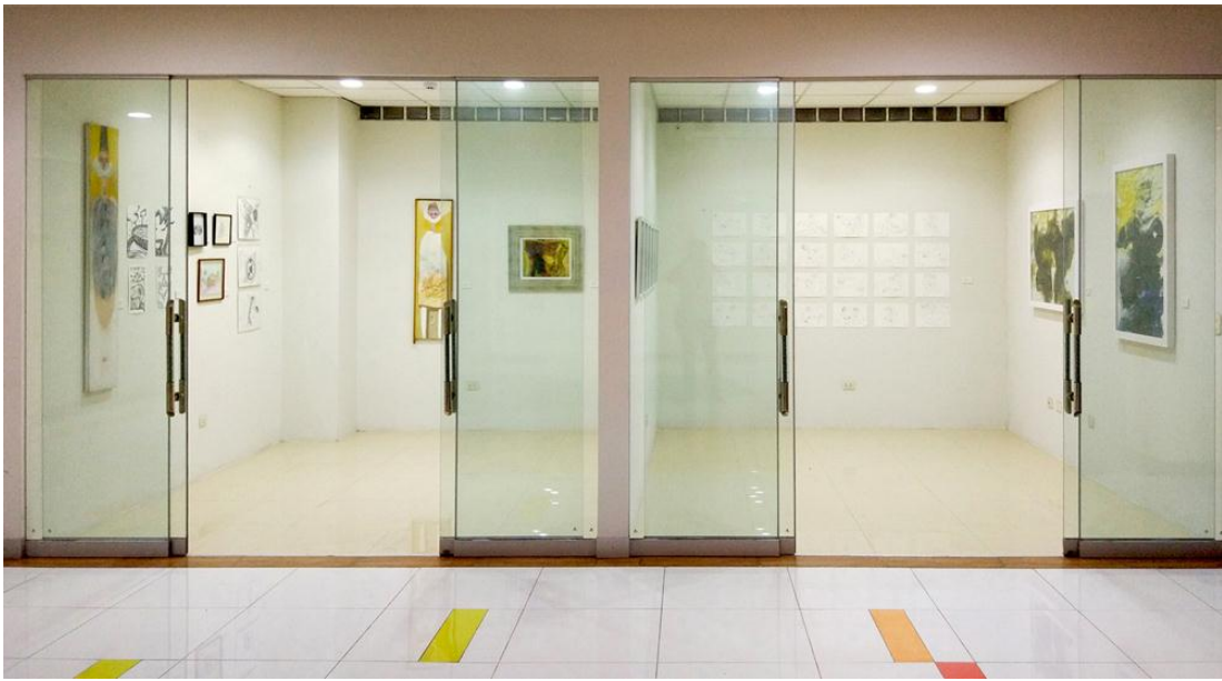
Salas 6 y 7