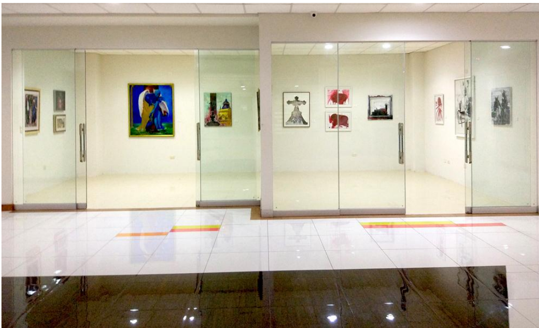
Salas 3 y 4